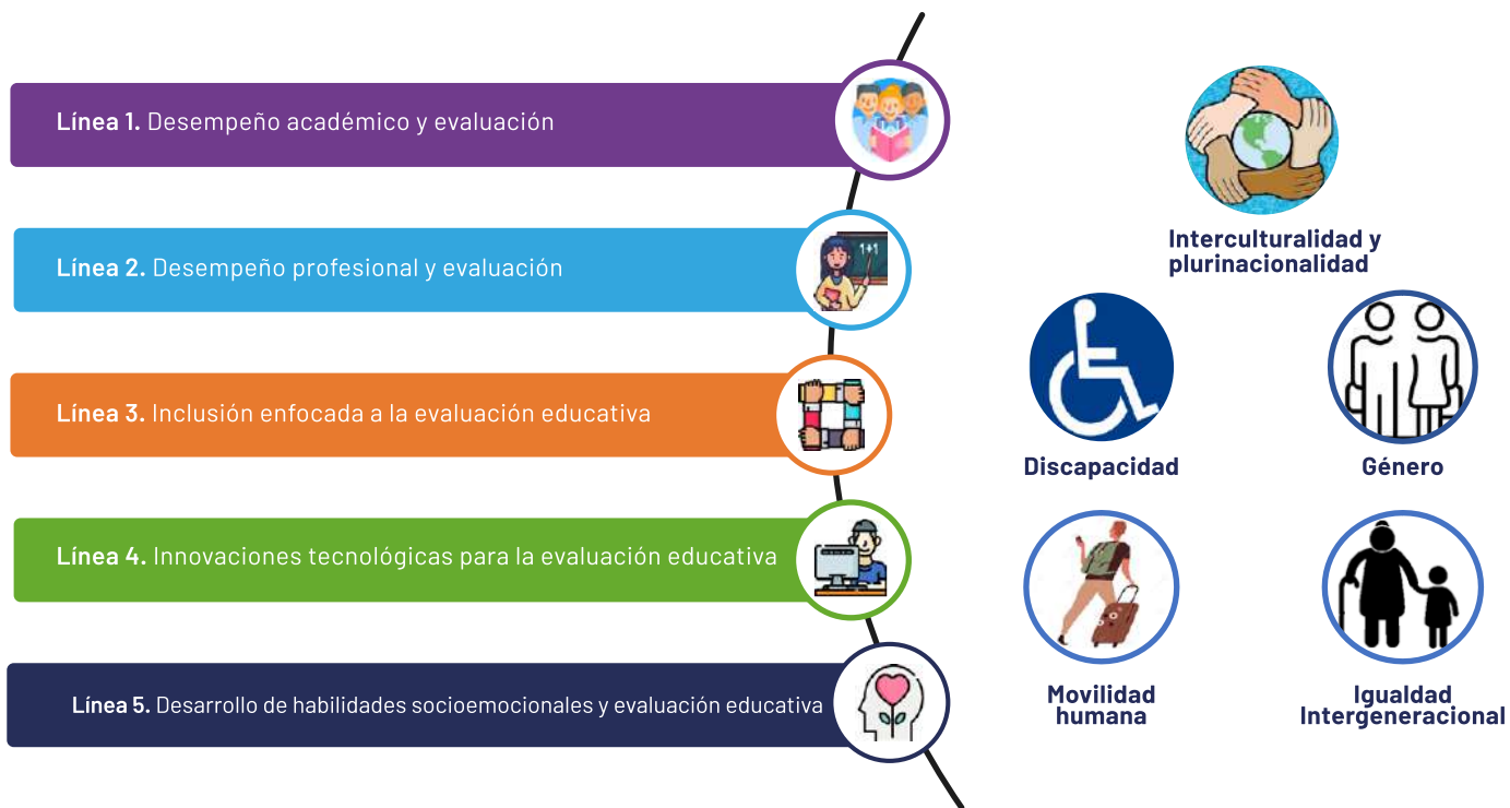
Gráfico 1. Enfoques transversales de la Agenda de Investigación en Evaluación Educativa 2022 - 2025

Nota: Actualizado por la Dirección de Análisis de la Evaluación Educativa, Ineval, 2024.